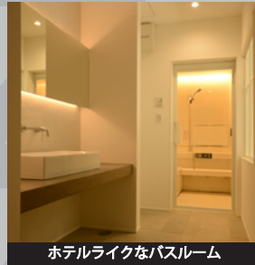
ホテルライクなバスルーム