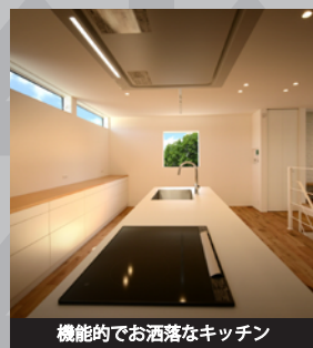
機能的でお洒落なキッチン