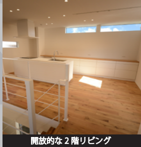
開放的な2階リビング