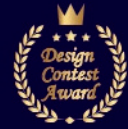
Case1: 丘ノ上のつどいの家 / 平屋