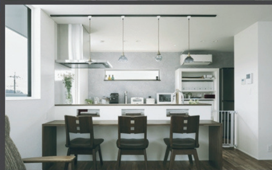
Case3: 凜と佇み灯す家 / 総2階