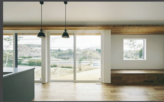
Case2: 縁が広がる家 / 店舗型住宅